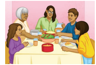
la salle à manger (f) dining room