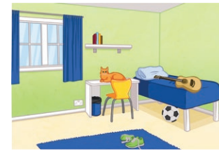
la chambre (f) bedroom