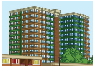
l'appartement (m) flat