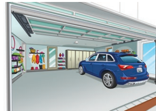
le garage (m) garage