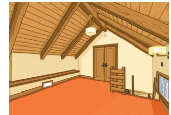
le grenier (m) attic/loft