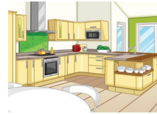
la cuisine (f) kitchen