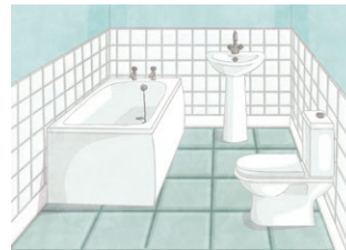
la salle de bains (f) bathroom