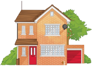
la maison (f) house