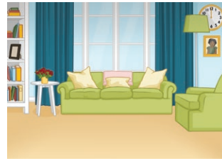
le salon (m) living room/ lounge