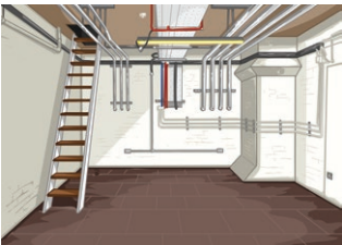
la cave (f) cellar